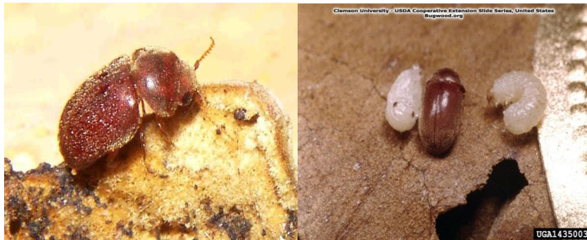
Lasioderma serricorne Fabricius