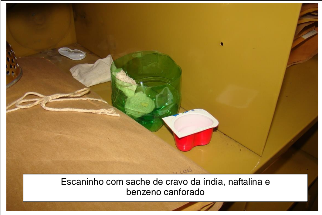
Escaninho com sachê de cravo da Índia, naftalina e benzeno canforado