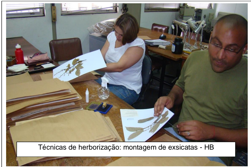
Técnicas de herborização: montagem de exsicatas - HB