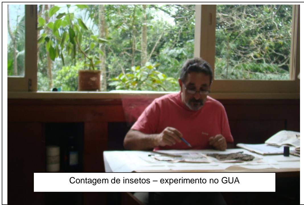
Contagem de insetos – experimento no GUA