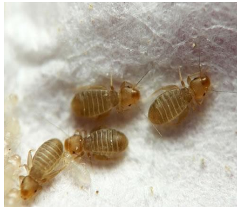
Liposcelis divinatorius (Müller)