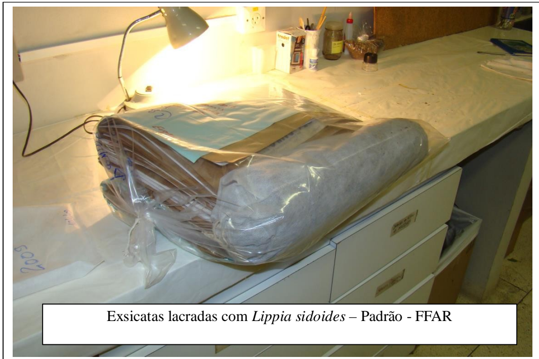
Exsiccatas lacradas com Lippia sidoides – Padrão - FFAR