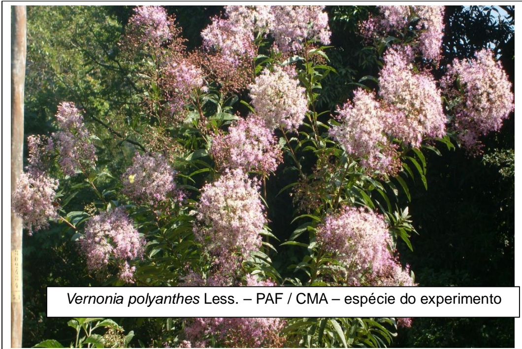
Vernonia polyanthes Less. – PAF / CMA – espécie do experimento