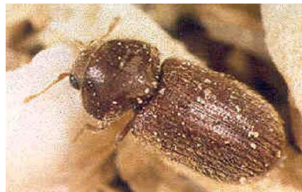
Stegobium paniceum (L.)