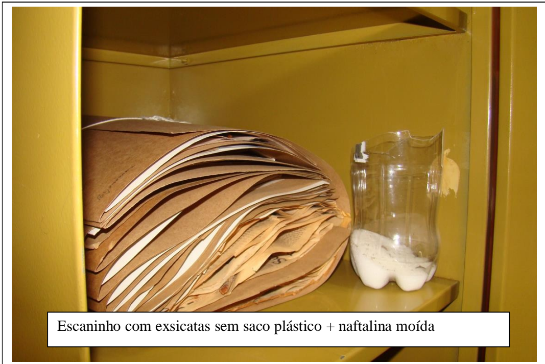
Escaninho com exsiccatas sem saco plástico + naftalina moída