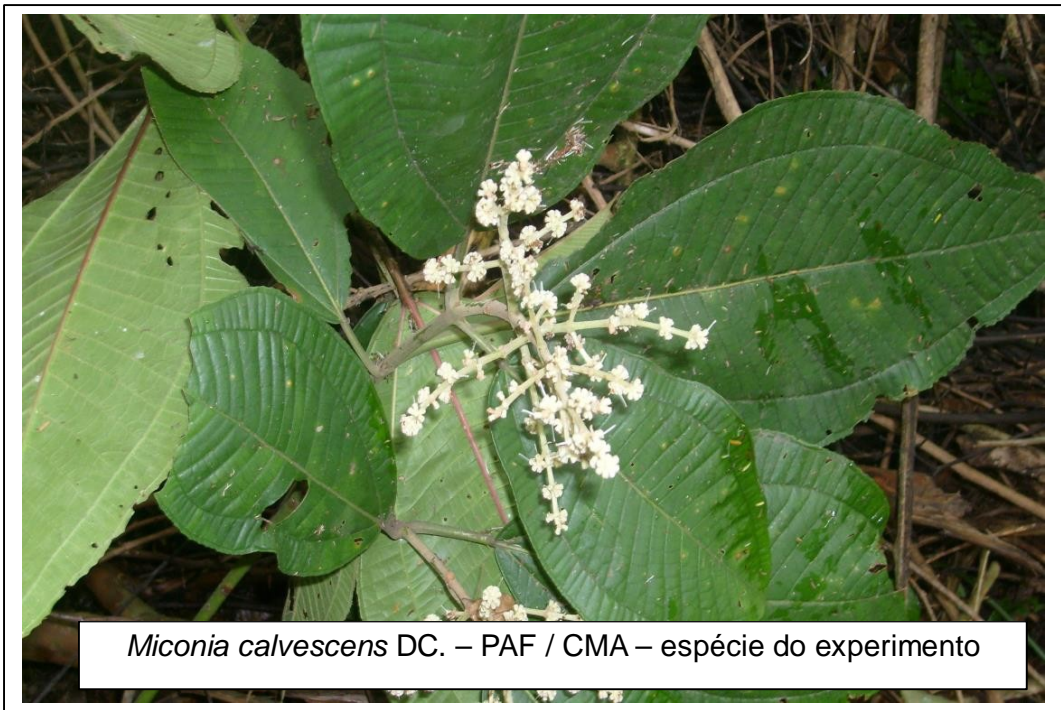
Miconia calvescens DC. – PAF / CMA – espécie do experimento