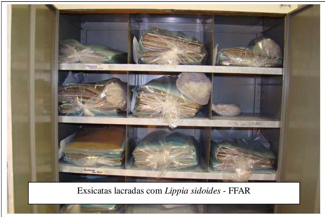
Exsiccatas lacradas com Lippia sidoides - FFAR