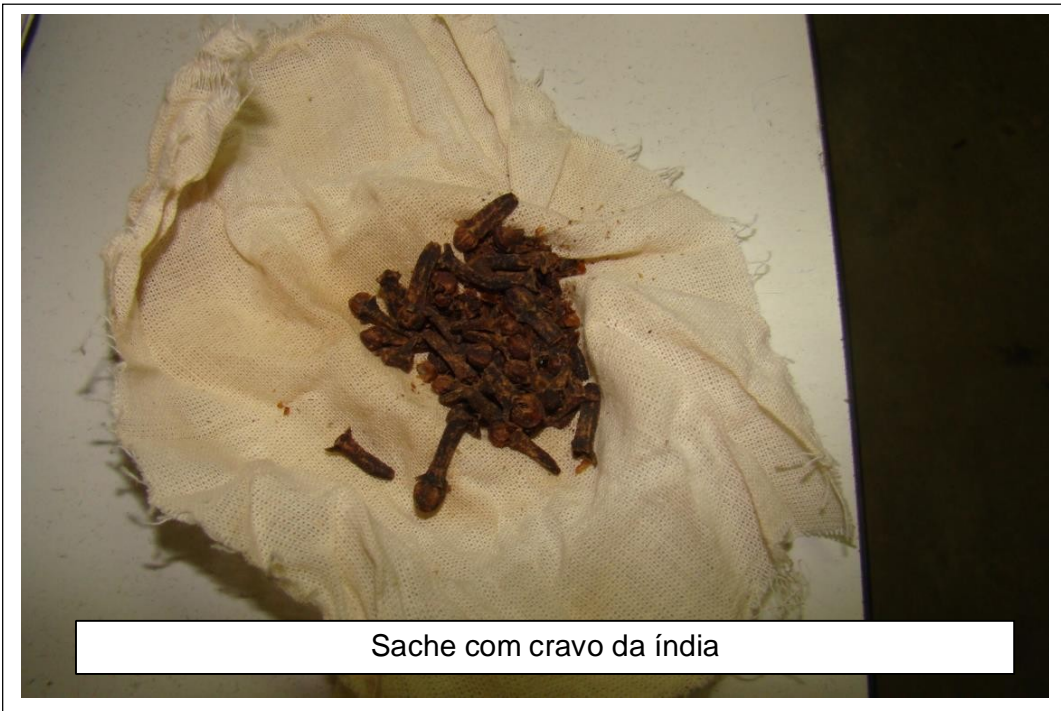
Sachê com cravo da Índia