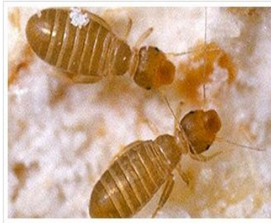
Trogium pulsatorium L.