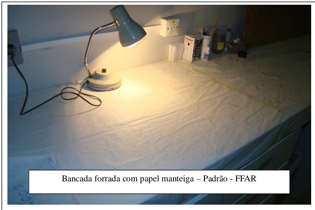
Bancada forrada com papel manteiga – Padrão - FFAR