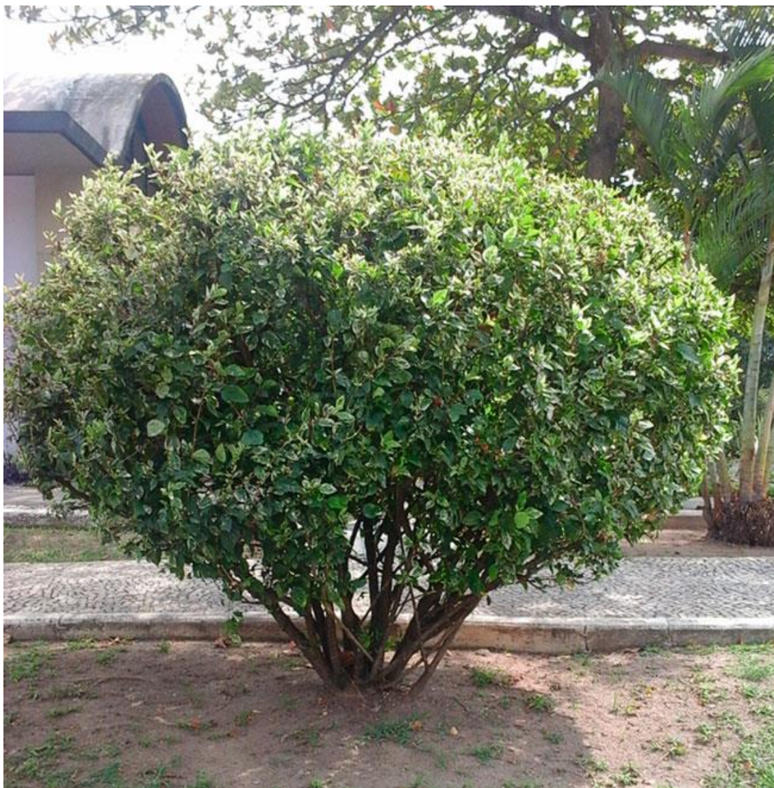
FIGURA 3: Indivíduo tratado com a formulação, sem a infestação de cochonilha.