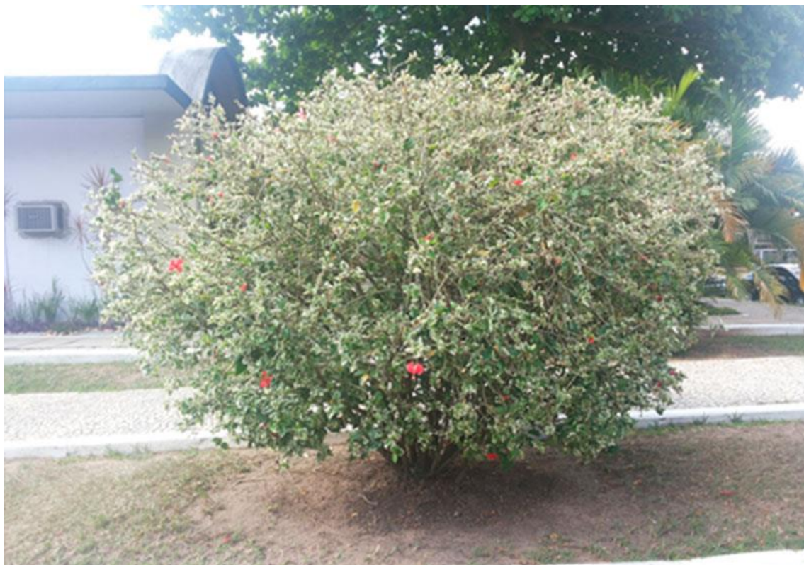
FIGURA 1: Indivíduo de Hibiscus utilizado para a avaliação da formulação proposta.

Neste trabalho, o uso de uma formulação contendo a mistura de pimentas e o fumo de rolo foi avaliado quanto a eficiência no combate à infestação de cochonilha ( Dactylopius coccus ) em um indivíduo de Hibiscus rosa-sinensis L., (ROMAHN, 2012) presente no CTM, conforme (FIGURAS 1 e 2).