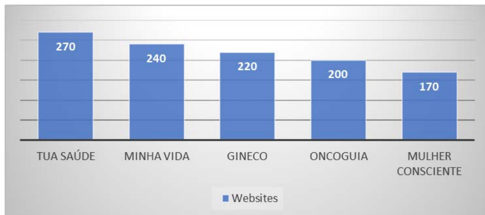
Gráfico 2. Resultados dos indicadores de qualidade com base no critério usabilidade

No Gráfico 2, é possível visualizar os resultados relacionados ao critério usabilidade aplicado a cada website avaliado.