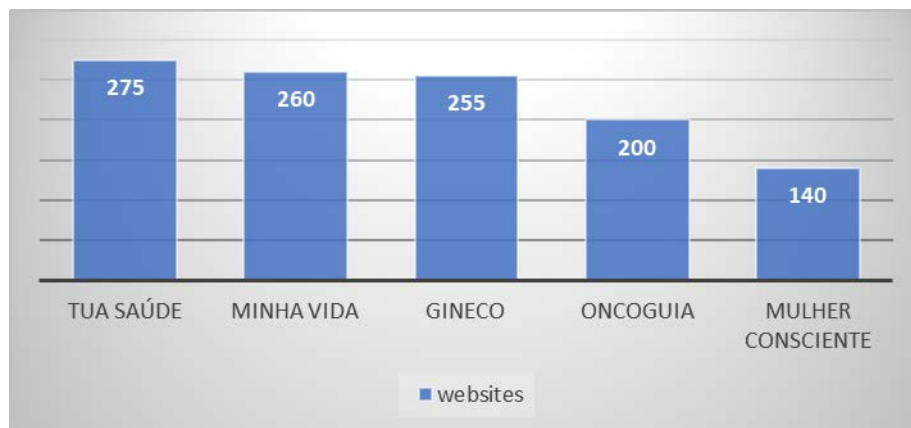
Gráfico 1. Resultados dos indicadores de qualidade com base no critério conteúdo

No Gráfico 1 é possível visualizar os resultados relacionados ao critério conteúdo aplicado a cada website avaliado.